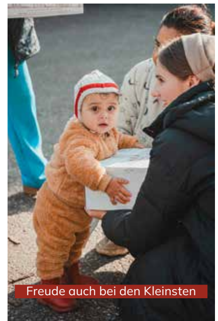
Freude auch bei den Kleinsten

In Mlenăuți verteilten wir Lebensmittelpakete und Schuhkartons. In einem Haus erlebten wir großen Segen, als wir Glaubensgeschwister besuchten. Der Mann kam gerade von der Arbeit ins Haus, als wir zu beten begannen. Er selbst war sterbenskrank mit einem schwarzen Bein, betete jedoch von ganzem Herzen für jeden von uns und für das ganze Dorf, dass alle zum Herrn finden mögen. Wir besuchten außerdem das christliche Kinderheim Cornerstone (Eckstein) in Dorohoi, das nur durch die Gnade Gottes und die Unterstützung der Gemeinde Cloppenburg entstehen konnte. Die Leiterin der Schule zitierte das Lied: „Da kann man nur staunen über Gott und über die Wunder, die Er tut.“