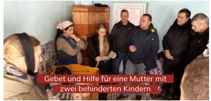
Gebet und Hilfe für eine Mutter mit zwei behinderten Kindern

Insgesamt 603 Pakete wurden vor Ort von uns an bedürftige Familien verteilt. Ein besonderer Höhepunkt der Reise war eine Evangelisation mit rund 200 Besuchern, die der Predigt aufmerksam bis zum Ende folgten. Zahlreiche Bibeln konnten verteilt werden. In Zusammenarbeit mit der örtlichen Verwaltung erreichten wir zudem Familien ohne kirchlichen Hintergrund und durften erleben, wie sehr die Menschen – Erwachsene wie Kinder – von der Hilfe und der Botschaft berührt wurden.