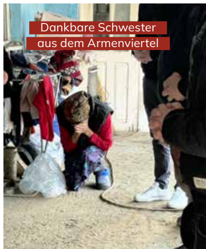
Dankbare Schwester aus dem Armenviertel