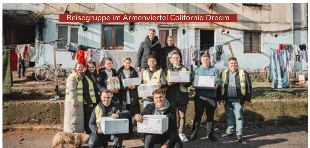
Reisegruppe im Armenviertel California Dream