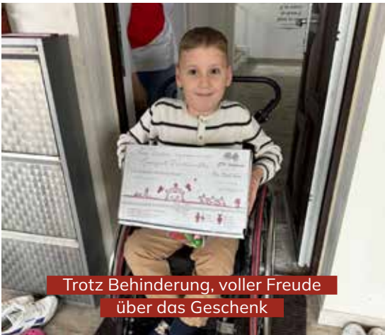
Trotz Behinderung, voller Freude über das Geschenk

In diesem Jahr führte die Weihnachtsaktion in das Land Rumänien. Obwohl Rumänien zur Europäischen Union gehört, gibt es Regionen, die von großer Armut geprägt sind. Sieben Gruppen mit insgesamt etwa 100 Personen brachen zu dieser Reise auf, um Weihnachts- und Lebensmittelpakete gezielt an Bedürftige zu verteilen. Gott berührte viele Herzen, sodass mehrere LKW-Transporte mit den Paketen nach Rumänien gebracht werden konnten, die von verschiedenen Firmen finanziert wurden. Insgesamt konnten 7.625 Lebensmittelpakete und 3.439 Schuhkartons an sieben Standorte geliefert werden.