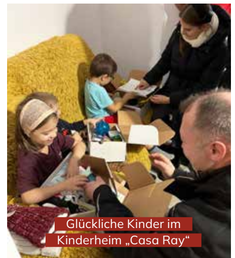
Glückliche Kinder im Kinderheim „Casa Ray“